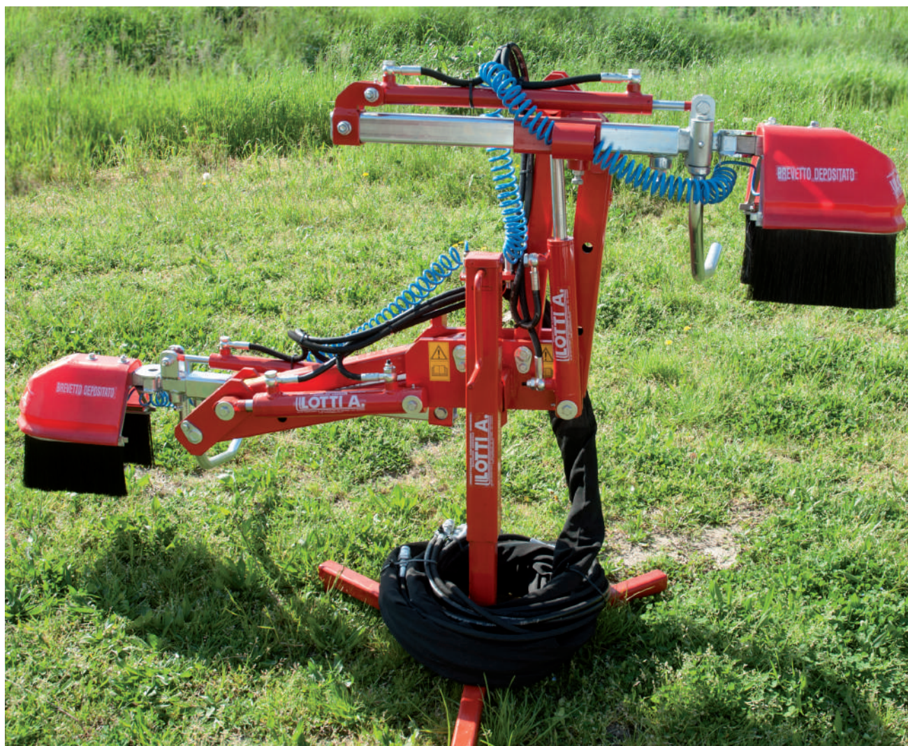
•Miniboom Lotti patented, one-sided also available