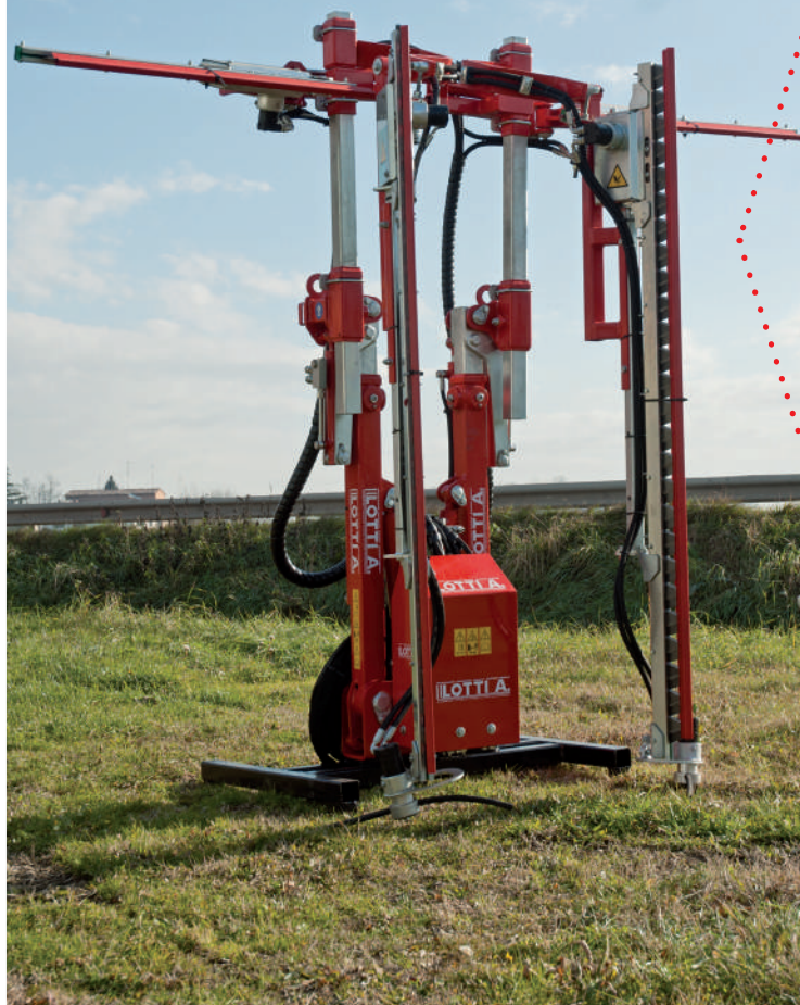
•Double mobile pruner